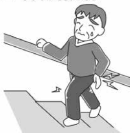
2 階段を上るのに手すりが必要である